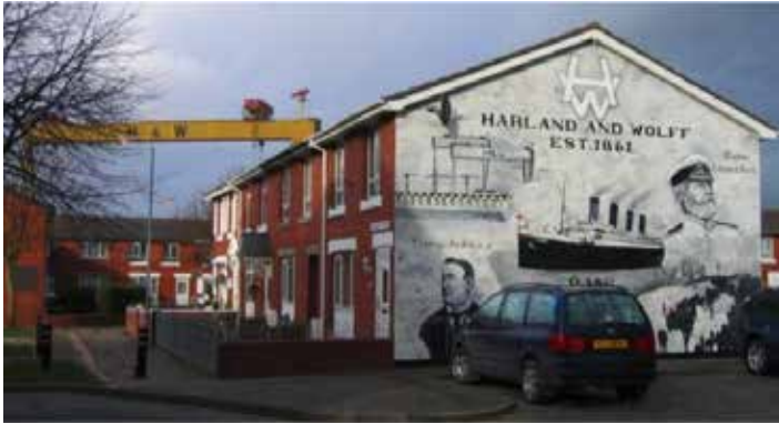
Belfast, die Werft „Harland & Wolff“ baute die Titanic

wartet mit zwei herausragenden, aus dem 9. Jh. stammenden Beispielen für Bibelhochkreuze auf. Abends: eine intensive musikalische Überraschung. Übernachtung in/bei Belfast.