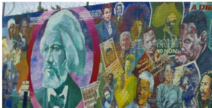
Mural in Belfast