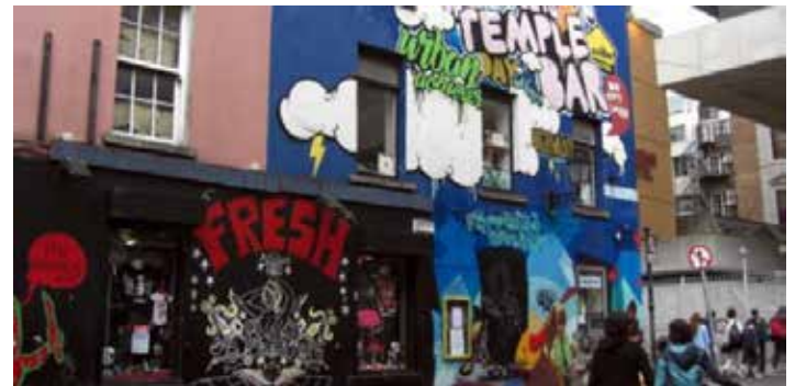
Dublin ist bunter geworden ...

Dublin total. Nach dem Frühstück machen wir eine Stadtrundfahrt mit anschließendem gemeinsamem Besuch des Kilmainham Jail. Das Gefängnis wurde 1796 erbaut. Viele Rebellenführer und nationalistische Politiker waren in Kilmainham inhaftiert, einige wurden hier hingerichtet. Nach der Unabhängigkeit Irlands