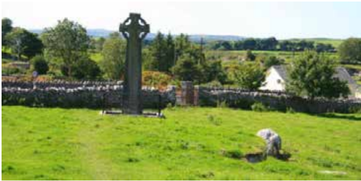
Ein keltisches Hochkreuz

blick in den Umgang Irlands mit seinen Sehenswürdigkeiten geben. Danach Besuch von Kilfenora mit seinem über 800 Jahre alten Doorty High Cross. Eine Besonderheit Kilfenoras: Es handelt sich um die einzige irische Gemeinde, die keinem Bischof, sondern direkt dem Papst unterstellt ist. Papst Franziskus ist somit genau