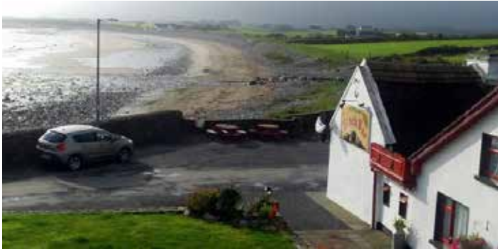
Sligo an der Atlantikküste