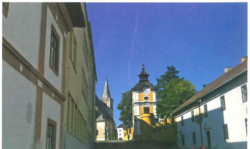
Kapitula Spišská in der Slowakei, das jüngste EBZ

Wir befinden uns im Zipser Kapitel, wie Spišská Kapitula auf Deutsch heißt; mit Blick auf die großartige Zipser Burg aus Travertin, dahinter das kleinste Hochgebirge Europas, die Hohe Tatra – nicht weit entfernt die Bezirkshauptstadt Košice – und alles eingebettet in eine noch wenig bekannte Kulturlandschaft mit einem ganzen Ring gotischer Kirchen. Die inhaltliche Europaarbeit