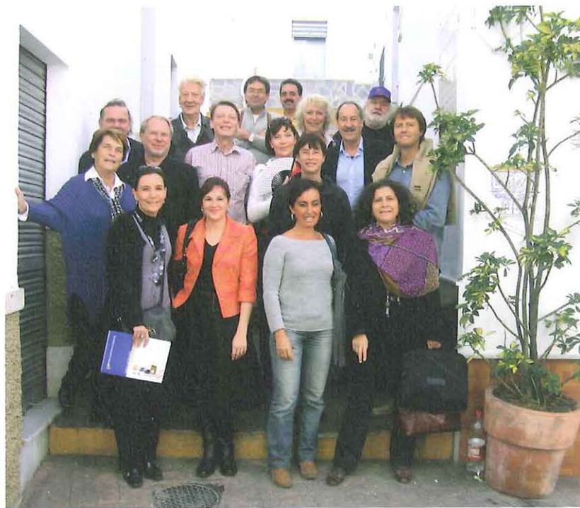
Alle EBZ-Mitglieder auf einen Blick

richtungen mit ausgeprägtem Programmprofil und eigenen Zielgruppen hinzu. Neben diesen beiden Bildungshäusern und Gaeltacht Irland, die heute noch zu den EBZ gehören, sorgten bald Erwachsenenbildungsverbände mit ihren Bildungshäusern für mehr Kontinuität in der Mitgliedschaft. Der slowenische VHS-Verband, der zweitgrößte schwedische Volksbildungsverband sfr und dessen finnischer Partnerverband OK traten bei,