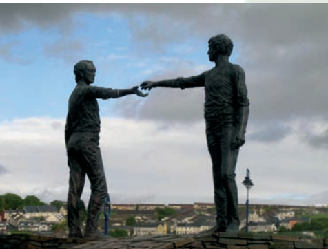
Das „Hands across the Divide“-Denkmal in Derry