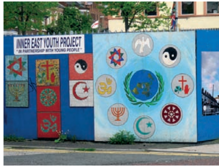
Eindrücke von der Fahrt mit Alastair Kilgore durch Belfast; das obere Bild verweist auf Ost-Belfast (in einem protestantischen Stadtgebiet), in der Nähe des Cluan Place.

Generationen werden in diese Gewalttätigkeit, die vor keiner Brutalität zurückschreckt, hineingeschleudert. Doch hier begin-