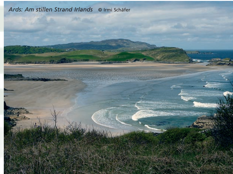
Ards: Am stillen Strand Irlands

So bleiben einzelne auch gerne weiter in dieser Atmosphäre des Friedens, als der größte Teil der Gruppe am Montag per Bus aufbricht zum Dunlewey Lakeside Centre und anschließend zum Glenveagh Nationalpark oder zum Mount Errigal, auf dessen Gipfel einem die ganze Schönheit dieser Region mit einem weiten Rundumblick im wahrsten Sinne des Wortes zu Füßen liegt. Eine Wanderung bzw. Busfahrt zum Geburtsort von St. Columba am Ufer des Lough Gartan, sowie ein gemeinsamer Besuch im Colmcille Heritage Centre am Nachmittag gehören ebenfalls zu den sonnigen Erfahrungen dieses Tages.