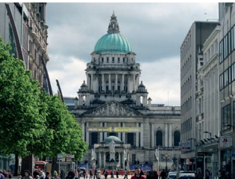
„Belfast City Hall“