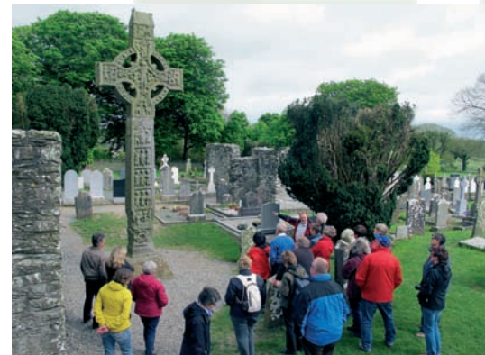
„Monasterboice Cemetery“: Irische Geschichte – eine Annäherung

Zweimal wegen „Aktivitäten für die IRA“ zu langjährigen Gefängnisstrafen verurteilt, gehörte er in den berüchtigten H-Blocks von Long Kesh zu den Häftlingen, die im August 1981 einen Hungerstreik begannen, um ihre Anerkennung als politische Gefangene durchzusetzen. 55 Tage Hun-