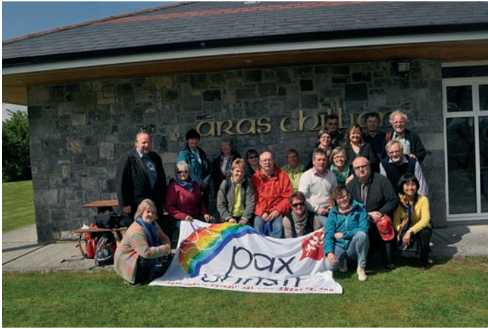
Die Reisegruppe aus Franken in St. Kilians Heimat