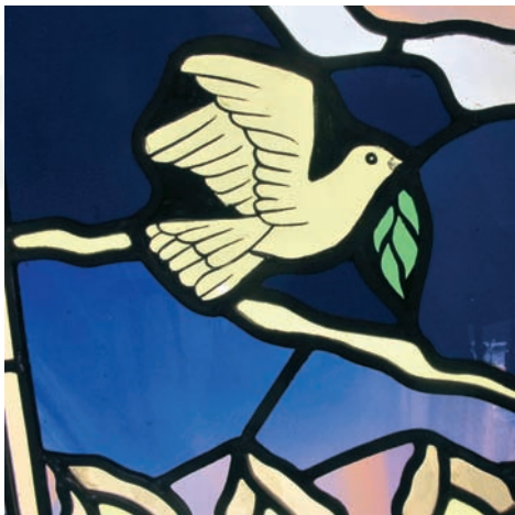
Friedenstaube im Colmcille Heritage Centre (Glasfenster-Detail), Donegal

Die Rückfahrt vom Nordwesten Irlands in Richtung Dublin enthält neue Höhepunkte. Noch einmal betreten wir in Fermanagh nordirischen Boden. Eine Bootsfahrt auf dem Lower Lough Erne führt uns nicht nur Burg Enniskillen, sondern auch den irischen Regen vor Augen und bringt uns auf die Klosterinsel Devenish Island. Dort bewundern wir nicht nur ein ganz besonderes (gotisches) Hochkreuz und das Innere eines Rundturms, sondern können auch im kleinen Museum einen Eindruck von einer großen Klosteranlage in einer faszinierenden Umgebung gewinnen. Bis zu 1500 Mönche sollen hier gelebt und gearbeitet haben. Am Abend dürfen wir nochmals staunen über einen großartigen Sonnenuntergang an unserem letzten Quartier am See von Virginia.