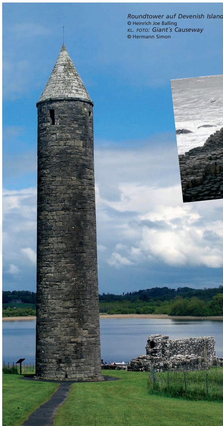
Roundtower auf Devenish Island © Heinrich Joe Balling KL. FOTO: Giant's Causeway © Hermann Simon