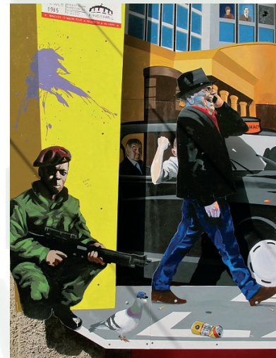
„armed shopping“ – Wandmalerei in der Innenstadt von Belfast, mitten im Einkaufsviertel

Hier in Belfast ist alltäglich gelebte Ökumene ein Programm von existentieller Notwendigkeit und alles andere als ein Terrain für wohlfeile theologische Gespräche und Spitzfindigkeiten. So leitet uns beim Austausch der Adressen an beiden Begegnungsabenden die Hoffnung, die geknüpften Kontakte nicht versanden zu lassen und der Wunsch für die engagierten Menschen, die wir kennen lernen durften, ist, dass ihr Einsatz weiter heilsam im Sinne eines Friedensprozesses auf allen Ebenen sein möge.