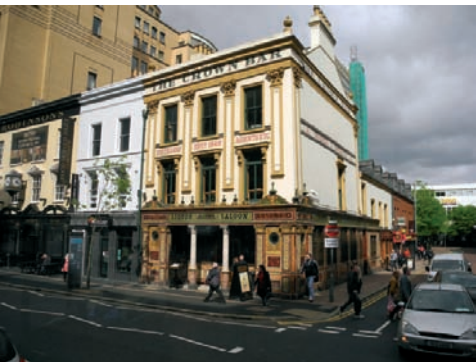
„Crown Liqueur Salon“