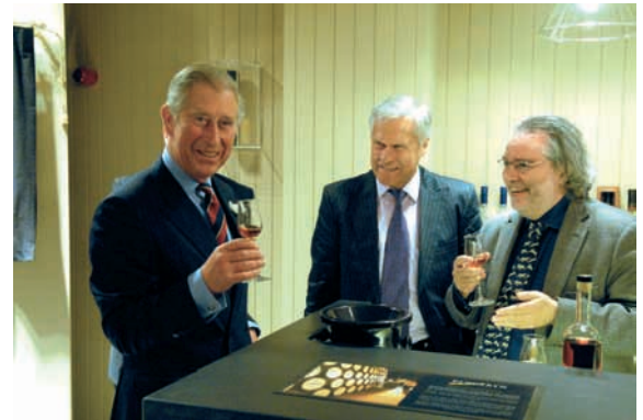
Prince Charles lächelte zur Eröffnung in die Kameras.

Öffentlichkeitswirksam präsentierte am walisischen Nationalfeiertag Saint David's Day , am 1. März 2004, His Royal Highness Prince of Wales den ersten Penderyn Single Malt Whisky der Welt: „the smoothest wysgi on earth.“ Prince Charles Wertschätzung walisischer Destillierkunst manifestierte sich darüber hinaus in seiner Anwesenheit bei der Eröffnung des Besucherzentrums im Juni 2008. Die Qualität eines Penderyn Single Malt Whisky in natürlicher Faszstärke überzeugte ihn: „Delicious, you don't get many like that.“