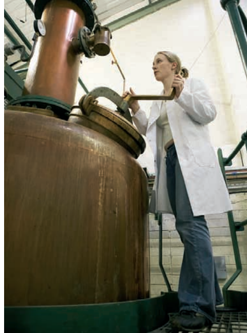
Alles im Griff: In Penderyn gibt es die Tröpfchen-Destillation.

oder Tröpfchen-Destillation, die acht bis zehn Stunden dauert, entstehen 200 Liter Spirit mit einem sehr hohen Reinheitsgehalt. Ein intensiver langanhaltender Kupferkontakt ermöglicht durch die große Länge der Säulen, mehrere perforierte Kupferplatten, das ständige Rückführen der Alkoholdämpfe die Herstellung eines sehr reinen und leichten Alkohols, wie er in dieser Art mit