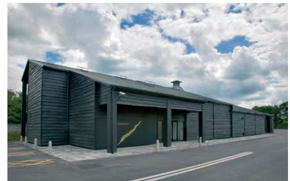
Das Besucherzentrum Penderyn lockt die Besucher seit 2008.