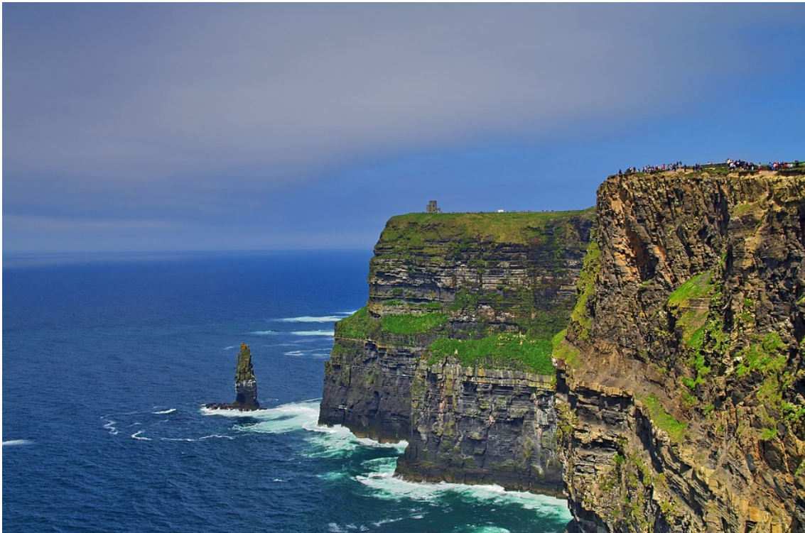
(Titelbild: Cliffs of Moher)