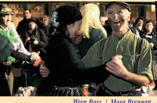
Wren Boys | Moya Brennan