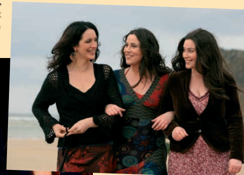
Henry Girls