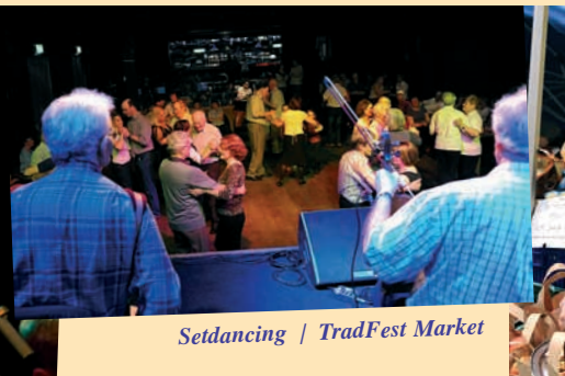
Setdancing | TradFest Market