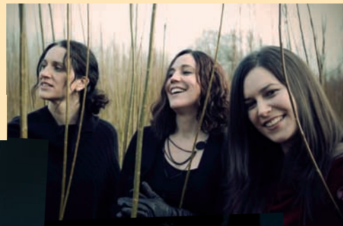
Henry Girls