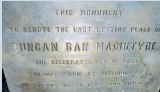
Gälische Inschrift auf Duncan Bàn MacIntyre's Memorial auf Greyfriars Kirkyard, Edingburgh, Schottland.

ponierte er sein Abschiedslied Cead Deireannach nam Beann, „Letzter Gruß an die Berge“ bzw. „Ein Lebewohl an die Berge“, das die Eindrücke des gealterten Dichters schildert, wie sich der Berg und seine Umgebung seit seiner Zeit als Wildhüter verändert hatte. Und das hatte er zu Duncan Bàn's Kummer tatsächlich, denn man sah deutlich die Spuren der Clearances, die mittlerweile auch in Breadalbane betrieben wurden: