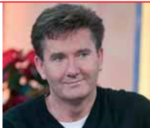
Freeman of Donegal: Daniel O'Donnell