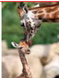
Zuwachs in der 'Afrikanischen Savanne' – Giraffenbaby im Dubliner Zoo