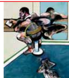
Francis Bacons 'Figure Writing Reflected in Mirror'