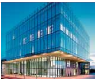
Wexford County Council HQ

„Show Your True Colours“ in Dublin vom Garden of Remembrance bis zur Baggot Street paradierte. *** Teleperformance rekrutiert 400 neue Mitarbeiter in Newry und Bangor in Co Down für seinen Kundenservice. *** 300 Euro Strafe und vier Jahre Führerscheinentzug verhängte das Gericht gegen Folk-Diva Dolores Keane , nachdem sie zum wiederholten Mal mit Alkohol am Steuer ertrappt worden war. *** In Tallaght wurde der Sinn Féin-Councillor Cathal King von seinen Kollegen im Grafenschaftsrat zum Bürgermeister von South Dublin County gewählt. *** Zum ersten Mal hielt Anfang Juli ein Generalsekretär des Orange Order eine Rede vor dem irischen Senat – Drew Nelson sprach sich dabei für mehr Kooperation zwischen Republikanern und Unionisten aus und forderte die irische Regierung auf, eine Orange Parade in Dublin zuzu-