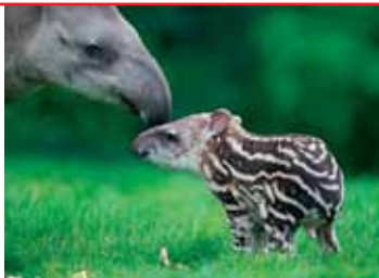
Tapir-Nachwuchs im Dubliner Zoo

Stormont am 27. Juni waren innerhalb weniger Minuten vergriffen. *** Zuwachs im Dubliner Zoo . Die brasilianischen Tapir-Eltern Rio und Marmaduke durften sich über ein neugeborenes Tapir-Kälbchen freuen. *** Corks Airport Hotel (145 Betten), in das vor fünf Jahren 40 Mio. Euro investiert wurden, steht für 4,75 Mio. Euro zum Verkauf. *** Villagers , Jape , Pugwash , Neil Hannon und Mick Pyro haben mit 'The Shortest Night' ein Benefiz-Album mit Soul Covers für die Simon Community eingespielt, die sich um Obdachlose kümmert. *** Die Totenmaske von James Joyce aus purem Silber des Schweizer Bildhauers Paul Speck war im Juni erstmals öffentlich ausgestellt – im Hunt Museum in Limerick. *** Am 22. Juni erhielt der Sänger Daniel O'Donnell die Ehrenbürgerwürde von Donegal. Er ist erst der fünfte, der so ausgezeichnet wurde.