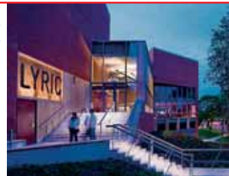
Das neue Lyric Theatre in Belfast