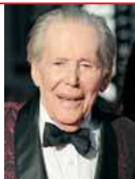
Peter O'Toole – beendet seine Schauspielkarriere kurz vor seinem 80. Geburtstag