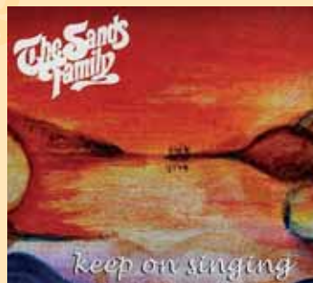
Keep on Singing

There was music in my mother's house There was music all night long There was music in my mother's house And my heart still sings the song.