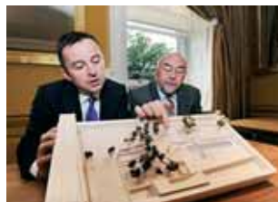
Brian Hayes und Ruairi Quinn Staatssekretär Brian Hayes und Ruairi Quinn bei der Vorstellung der Pläne

Der Entwurf versuche, so die Architekten, eine „fließende Progression zwischen dem Garden of Remembrance, der an jene erinnert, die im Kampf um Irlands Freiheit ihr Leben ließen, und dem Denkmal für die jungen Missbrauchsoffer“ herzustellen.