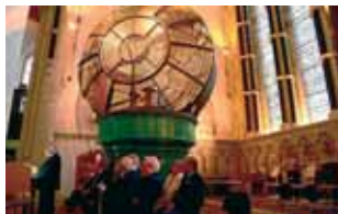
Die Optik des Baily-Leuchturms von Howth – mit der Strahlkraft von 2 Mio. Kerzen

Sechs Jahre dauerte die Renovierung, aber im Juni war es endlich so weit: Präsident Michael D Higgins konnte zur Tat schreiten und das Nationale Seefahrtmuseum in Dún Laoghaire neu eröffnen.