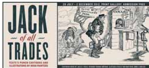
Jack of all Trades