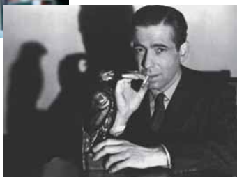
Philip Marlowe (Humphrey Bogart)