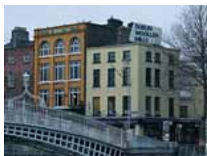
Dublin Woollen Mills

Während in Dublin der 'Bloomsday' gefeiert wurde, schlossen sich die Türen für die Dublin Woollen Mills, für die James Joyce einst gearbeitet hat, nach 124 Jahren zum letzten Mal.