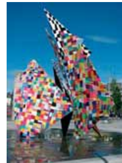
Galway Hooker Statue

EINE BESTRICKENDE IDEE: DAS GALWAY HOOKER-DENKMAL IM PATCHWORK-LOOK Grundschulkinder gaben dem Denkmal am Eyre Square ein neues, buntes Gewand. 'Yarnbombing' nennt sich das – und bei dieser Aktion am 4. Juni waren 134 Kinder im Alter von 8-13 Jahren mit von der Partie. Mit 2086 Flickern aus 300 Wollknäueln.