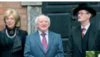
Präsident Michael D Higgins und seine Frau amüsieren sich am 16. Juni in Gesellschaft von Mr. Joyce....

... während Demonstranten vor dem GPO Leopold Bloom für ihren Protest gegen den Sparkurs der irischen Regierung vereinnahmen. ■