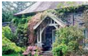
Cottage Garinish Island

Die berühmte Garteninsel Garinish Island in West Cork erhält 2,4 Mio Euro, um das Gardener's Cottage zu einem Inselmuseum auszubauen, das die Geschichte der Insel erzählen soll.