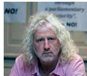
Mick Wallace TD

auf 290 000 Euro im Jahr genehmigt. Da blieb dann eben 2008 kein Geld mehr in der Kasse, um die Steuern zu bezahlen. Pech.