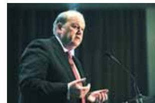
Finanzminister Michael Noonan

Bildungsminister Ruari Quinn sagte: „Diese Regierung hat von Anfang an versucht, den für das Land verheerenden Deal der vorhergehenden Regierung neu zu verhandeln. Unsere Position hat sich nicht verändert. Die Verhandlungen gehen weiter, und wir machen langsame, aber stetige Fortschritte.“