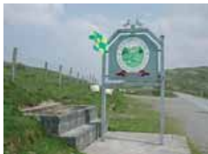
Nur das Wirtshaus-schild steht noch: The Top Of Coom Pub in Co Kerry

The Top of Coom Pub an der Grenze zwischen den Grafschaften Cork und Kerry gilt als Irlands höchstgelegene Wasserstelle. Im Mai wurde der 318 Meter über dem Meeresspiegel gelegene Pub ein Raub der Flammen.