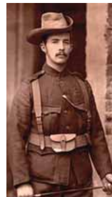
Erskine Childers (1870-1922)

Jimmy Deenihan, Irlands Minister für Kultur, historisches Erbe und die Gaeltacht, freute sich bei der Vorstellung darüber, dass mit der ‘Asgard’ Perspektiven enormer historischer Umwälzungen erlebbar werden. „Die Asgard verbindet uns direkt mit stürmischen Zeiten, vor hundert Jahren, als die Zukunft Irlands, Großbritanniens und Europas an der Schwelle großer Veränderungen standen.“