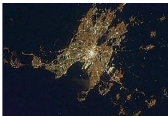
Das Bild steht auf dem Kopf – Howth Head ist unten, der Phoenix Park (die schwarze Fläche) oben.

Eine Weltpremiere – der kanadische Astronaut Chris Hadfield, dessen Tochter in Irland lebt, und der auch ansonsten ein Faible für die Insel zu haben scheint, schickte nicht nur eine Aufnahme von Dublin aus der Erdumlaufbahn, sondern er tweetete dazu auch auf Irisch.