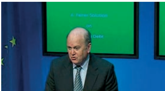
Finanzminister Michael Noonan

In einer Nacht- und Nebelaktion hatte die Regierung sich im Dáil die Genehmigung geholt, die bankrotte Skandal Anglo Irish Bank abzuwickeln. Die beim Staat geparkten Schulden wurden flugs an die Zentralbank des Landes verschoben, um sie über langfristige Staatsanleihen zu finanzieren. Zurückbezahlt wird erst ab dem Jahr 2038.