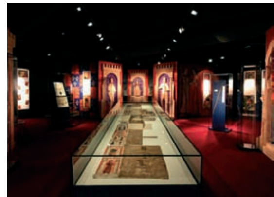
Das Waterford Museum of Treasures

Für 2013 stehen für die Entwicklung lokaler und regionaler Museen in Irland zusätzliche 300 000 Euro zur Verfügung, kündigte Kulturminister Jimmy Deenihan an, vor allem, um Kulturtourismus zu stimulieren.