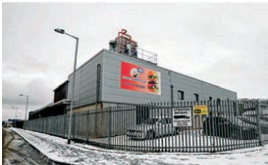
Freeza Meats Ltd in Newry.

Mittlerweile hatte der Pferdefleischskandal europaweite Kreise gezogen, von Rumänien und Polen über Frankreich, Luxemburg und Holland bis nach Deutschland.