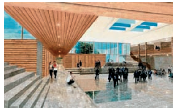
Erstes Projekt ist eine Schule in Kingswood, Tallaght, für rund 1000 Schüler. ■

Über bloße Funktionalität hinaus sollen die neuen Schulen auch ästhetisch ansprechend sein, so der Minister, der selbst von Beruf Architekt ist. Deshalb gab es im letzten Jahr einen international ausgelobten Design-Wettbewerb (unter der Ägide des Royal Institute of Architects, Ireland), an dem sich 154 Architekturbüros aus insgesamt 14 Ländern beteiligten. Den Zuschlag bekam ARPL Architects aus Ayr in Schottland.