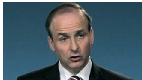
Fianna Fáil Chef Micheál Martin

Nach einer am 17. Februar veröffentlichten Sunday Independent Millward Brown-Umfrage liegt Fianna Fáil bei 27%, zwei Prozentpunkte vor Fine Gael. Sinn Féin liegt mit 20% an dritter Stelle. Labour hat deutlich eingebüßt und kommt nur noch auf 13%. Unabhängige kommen auf insgesamt 14%, während die Grünen und die United Left Alliance bei jeweils einem Prozent herumdümpeln.