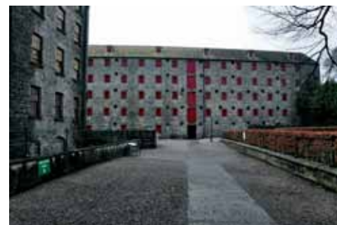
Die ehemaligen Grain Lofts