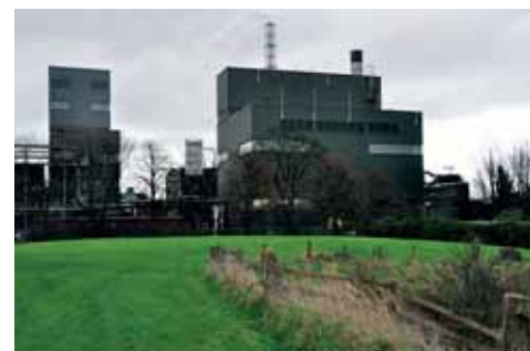
Midleton Distilleries heute, zweckmässig und effizient, für Touristen geschlossen