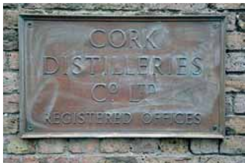
Die Cork Distilleries entstanden 1867, mit Sitz in Midleton .

Gern getrunken wurde John Jamesons Whiskey seit dem Ende des 18. Jahrhunderts. Er genoss stets einen sehr guten Ruf. Nach 1900 schlitterte allerdings die Dubliner Jameson & Son Distillery in eine teilweise selbstschuldete Krise, die bis in die 1970ziger Jahre reichen sollte. Ursachen waren das sture Festhalten am traditionellen Irish Pot Still (ein Whiskey aus nicht gemälzter und gemälzter Gerste), die Erfindung der Coffey Patent Still , die Ablehnung der Grain-Whiskies und damit der Blended Whiskies , die Abspaltung Irlands vom Vereinigten Königreich, der damit verbundene Verlust der Märkte, die amerikanische Prohibition, die Weltkriege, die hohen Alkoholsteuern und die Hinwendung der Iren zum günstigen Bier. Eine Summe von Faktoren bewirkte, dass es nach 1950 lediglich acht Brennereien auf der Emerald Isle gab: Bushmills , Coleraine , Comber , Jameson & Son , John Locke , Midleton , Power & Son und Tullamore . Die glorreiche Zeit irischer Destillationskunst war nur noch eine wehmütige Erinnerung. 1835 hatten 93 Brennereien die Welt mit 50,2 Millionen Litern „Wasser des Lebens“ überschwemmt.