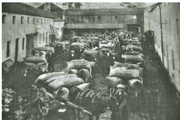
Gerste wird von den Bauern angeliefert.

Die verbliebenen BIG TWO Jameson und Power qualitäten sich mit ihren antiquierten süßen, vollmundigen, kräftig aromatischen, würzigen Pot Still -Produkten auf dem Weltmarkt. Die schottischen Blends waren längst in aller Munde, sie wurden wegen ihrer ansprechenden geschmacklichen Qualität gerne getrunken und sind bis heute sehr erfolgreich. Johnnie Walker entwickelte sich zum Weltmarktführer. 18 Millionen verkaufte „nine litre cases“ im Jahr 2011 machten den Schotten zum meistgetrunkenen Whisky weltweit. Sein irischer Cousin Jameson nahm im gleichen Jahr Platz 58 in der Weltrangliste ein. Allerdings wuchs er mit einem Plus von 19,2 %