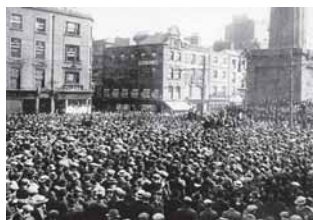
Streik in Dublin 1913

damaligen „Bloody Sunday“. Higgins sagte, die Ereignisse des Jahres 1913 seien ein „wichtiges Kapitel in der Geschichte der irischen Arbeiterbewegung“ gewesen.