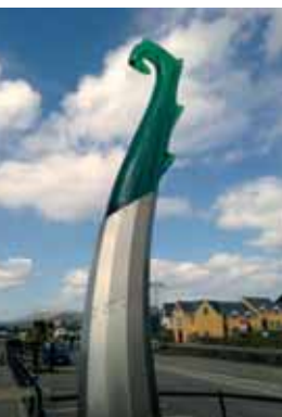
Die „Sea-Form“-Skulptur in Dingle

Die im März enthüllte neue Skulptur des Bildhauers Joe Neeson aus Killarney, die mit dem Kunstprogramm „Percent for Art“ vom Kerry County Council finanziert wurde, hat ästhetisch viel Anerkennung erfahren, aber auch eine intensive Diskussion ausgelöst, ob fast 50.000 Euro für öffentliche Kunst in Zeiten der Austerität gut angelegtes Geld sind.