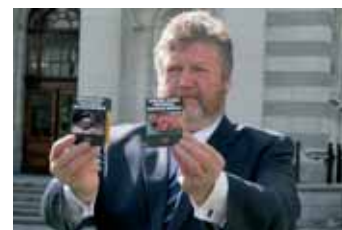
Gesundheitsminister James Reilly mit Beispielen der neuen Zigarettenverpackungen

Als zweites Land nach Australien hat Irland beschlossen, dass Zigaretten nur noch in Einheits-schachteln verkauft werden dürfen. Die werbefreie, einheitliche Gestaltung von Zigaretten-schachteln, die künftig auf einfarbigem Grund zusammen mit einem abschreckenden Foto zu den gesundheitlichen Folgen des Rauchens nur noch den Namen der Marke in Einheitschrift zeigen dürfen, werde – so Gesundheitsminister James Reilly – helfen, Leben zu retten.