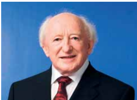
Präsident Michael D. Higgins

Nachdem er sich mit seinem Staatsrat getroffen hatte, so ließ Áras an Uachtaráin verlauten, hat Präsident Michael D. Higgins das vom Oireachtas – den beiden Häusern des irischen Parlaments – verabschiedete Abtreibungsgesetz unterschrieben, das damit am 30. Juli in Kraft trat.