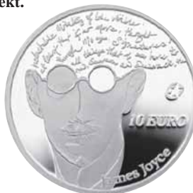
Joyce-Gedenkmünze der irischen Zentralbank

Gedenkmünze für James Joyce vorstellte, war schnell klar, dass ein peinliches Missgeschick passiert war. Das Ulysses-Zitat auf dem Silberling war nicht korrekt.