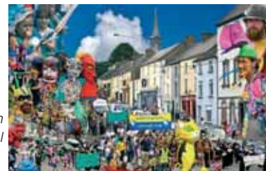
Abhainn Rí Festival

Es gehe also nicht darum, möglichst viele Kulturbeflissene nach Callan zu locken. Vielmehr konzentriere sich das Programm auf die Erkundung der ortsprägenden Gebäude und darauf, wie sie genutzt werden können, um mit den Menschen ins Gespräch zu kommen.