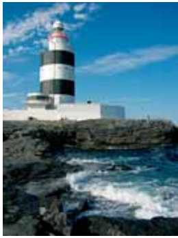
Leuchtturm am Hook Head

Ein „Gathering“ ganz besonderer Art fand vom 13. bis 15. September am ältesten noch funktionierenden Leuchtturm der Welt statt. Leuchtturmwärter aus aller Welt waren zur Teilnahme eingeladen.