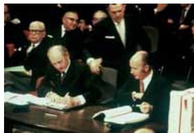
Taoiseach Jack Lynch und Außenminister Patrick Hillery bei der Unterzeichnung des Vertrages zum EG-Beitritt