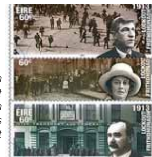
Briefmarken von An Post zum hundertsten Jahrestag des Dublin Lockout

Die drei im August herausgegebenen Gedenkbriefmarken zum hundertsten Jahrestag des Dublin Lockout zeigen historische Fotos des Arbeitskampfes mit drei seiner prominentesten Figuren: Gräfin Constance Markievicz, James Connolly und Jim Larkin.