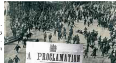
Bloody Sunday 1913

In der Dubliner Geschäftswelt umstritten war der Plan des Stadtrats, die O'Connell Street am 31. August für einen Tag für den Verkehr zu sperren, um an den „Bloody Sunday“ vor hundert Jahren zu erinnern, als die Polizei hier eine Gewerkschaftsdemonstration brutal niederknüppelte.