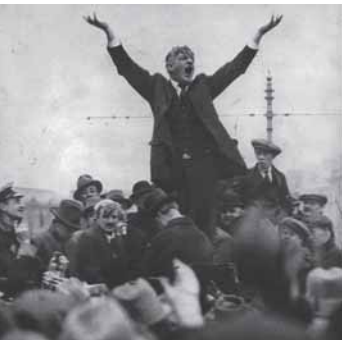
James Larkin in typischer Pose – „The great appear great because we are on our knees: Let us rise!“