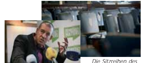
Professor Diarmuid Ferriter

Am 4. Oktober werden die Iren in einer Volksabstimmung über die Abschaffung der zweiten Kammer, also des Senats entscheiden. Ob die Regierung sich mit dem Vorschlag durchsetzen kann, bleibt abzuwarten. Nicht nur gibt es innerhalb der Regierungsparteien Widerstände – auch die Umfragwerte zeigen, dass die Iren in ihrer Entschlossenheit, dem Seanad den Garaus zu machen, wankelmütig zu werden scheinen.