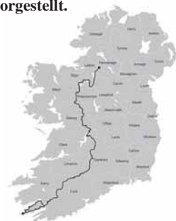
Die Route des Beara-Breifne-Wanderwegs

Fünfhundert Kilometer lang ist der neue Wanderweg, der von der Spitze der Beara-Halbinsel in West Cork bis nach Black-