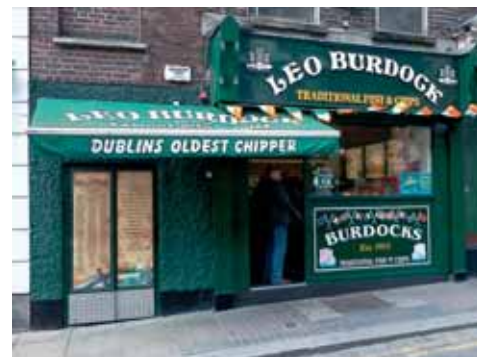
Leo Burdock's, Dublins ältester „Chipper“ heute

Beshoff’s ist für die Touristen, Burdock’s für die Einheimischen. Nun sind es sage und schreibe hundert Jahre, seit Leo Burdock’s in der Werburgh Street, gegenüber der Christ Church Cathedral, Kabeljau und Schellfisch, Scholle, Rochen und Seezunge im Teigmantel frittiert. Das Menü mag über die Jahre die ein oder andere Änderung erfahren haben, aber Ray & Chips sind nach wie vor der Renner.