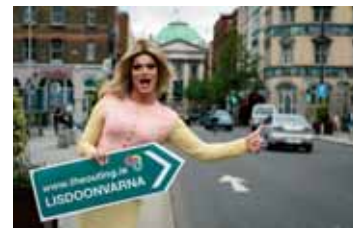
Lisdoonvarna – The Outing

Irlands ältestes Eheanbahnungsfestival steht jetzt auch ledigen Schwulen und Lesben offen. Ein neues Gay and Lesbian Weekend findet ab diesem Jahr zum Auftakt des traditionellen Lisdoonvarna Matchmaking Festivals statt.