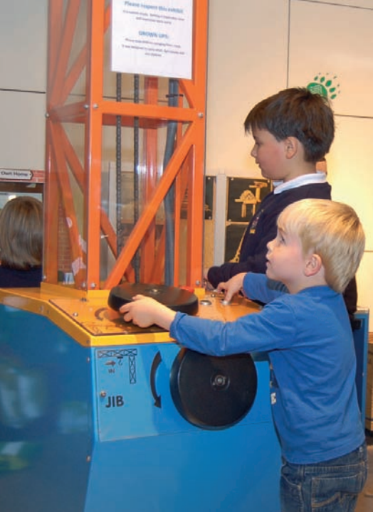
In der Erlebniswelt Imaginosity gehen die Kinder auf Erkundungstour.