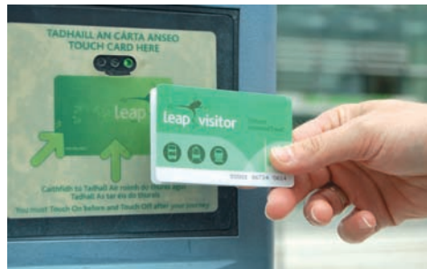
Wer viel unterwegs ist, fährt mit der leap visitor card besonders günstig.

Info: www.transportforireland.ie/leap-card/leap-visitor-card