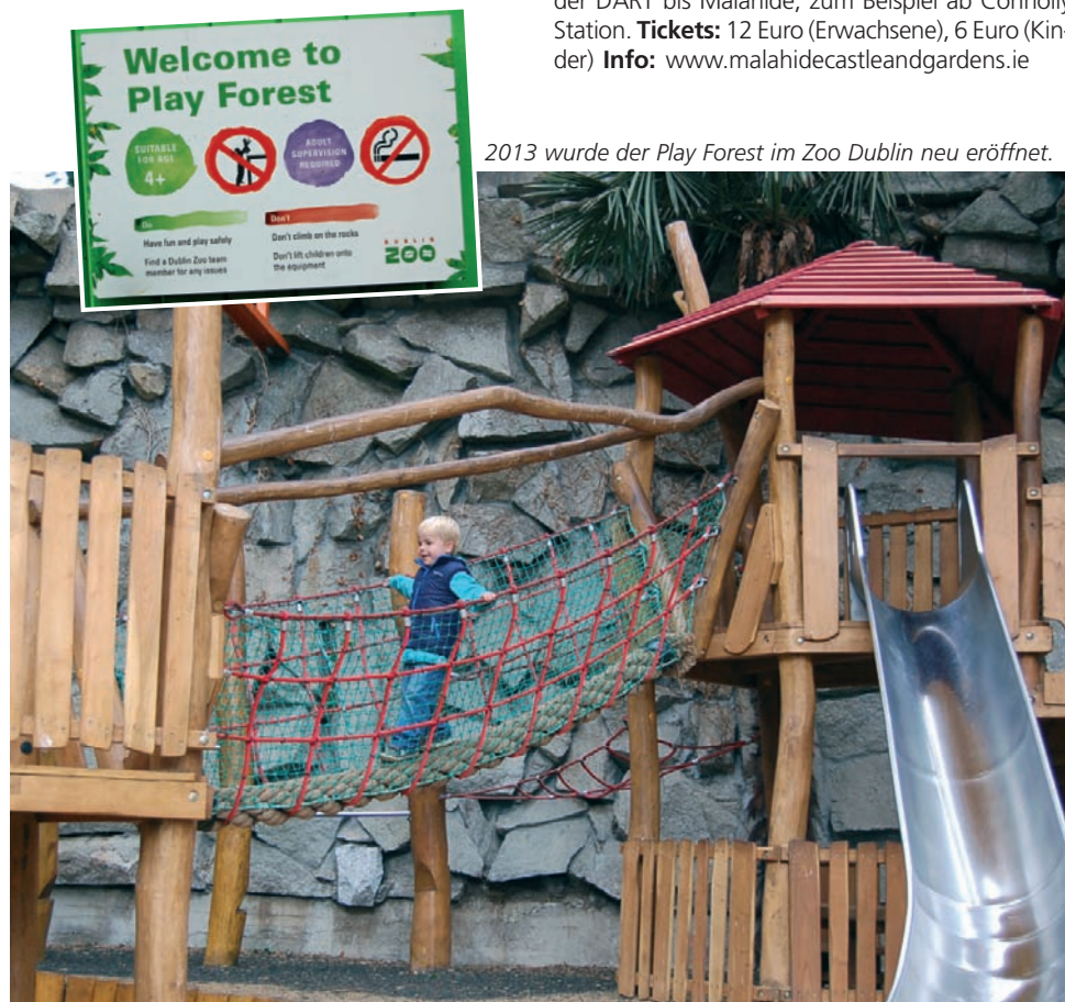
2013 wurde der Play Forest im Zoo Dublin neu eröffnet.

Anfahrt: Aus der City mit Buslinie 42 oder mit der DART bis Malahide, zum Beispiel ab Connolly Station. Tickets: 12 Euro (Erwachsene), 6 Euro (Kinder) Info: www.malahidecastleandgardens.ie