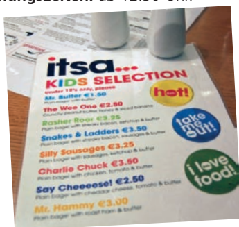
Blick auf das Kindermenü: it's a café in Sandymount.

Adresse: Harbour Road, Howth, Irland. Öffnungszeiten: ab 12.30 Uhr.