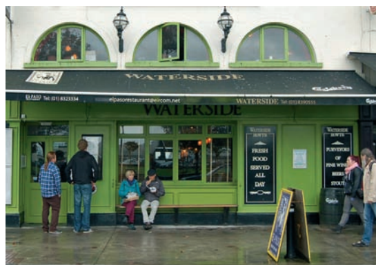
Gute Adresse für Fish & Chips: The Waterside Bar.