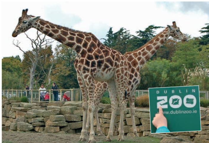
Giraffen in Dublins Zoo, der nicht nur für Kinder ein echtes Highlight ist.

teste Zoo der Welt. Seit seiner Privatisierung 1994 wurde er zu einem der modernsten Zoos Europas umgebaut, mit 400 Tierarten auf 28 ha. Besuch mit Nachwuchs lohnt auf jeden Fall. Wer Glück hat, bekommt auch für Kinder über 3 freien Eintritt. Zoogäste kommen den Tieren trotz der weitläufigen Gelände sehr nah. Aufteilung in Themengebiete wie Afrika, Asien, Gorilla Rainforest. Die Seehunde befinden sich aktuell im englischen Exil. Nach dem Umbau soll ein neues Gelände für sie und die Flamingos im Frühjahr 2015 eröffnet werden.