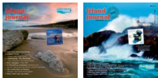
Die Ausgaben 1.14 & 2+3.14

Fast alle unserer Ausgaben der letzten Jahre sind eigentlich vergriffen. Ein gutes Zeichen und trotzdem schade – für Neulinge, die über „uns in Moers“ erst kürzlich oder jetzt gestolpert sind. Vieles aber, das wir beschreiben, hat keine Halbwertszeit, bleibt lange interessant und gültig. Auch einer der Gründe, warum wir viele alte Texte neu zur Verfügung stellen (Stichwort: 800 Dokumente).