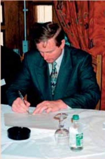
Der damalige Tourismusminister Enda Kenny unterschreibt