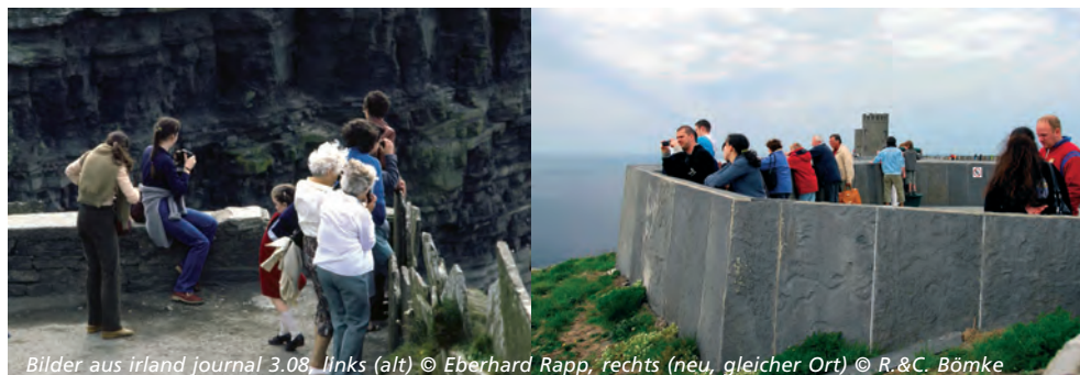
Bilder aus irland journal 3.08, links (alt), rechts (neu, gleicher Ort)

So übertitelten wir im Jahr 2008 unsere bebilderte irland journal-Gegenüberstellung von alt und neu. (Ausgabe 3.2008).