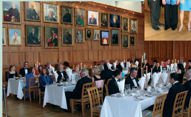
LINKS: Beim Charity Dinner at Queens