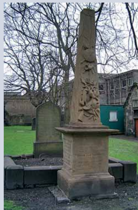
Duncan Bàn MacIntyre Memorial auf Greyfriars Kirkyard, Edinburgh, Schottland.

1802 unternahm Duncan Bàn eine letzte Reise in die alte Heimat, während der er auch noch einmal den Beinn Dòbhrain bestieg. Dort kom-