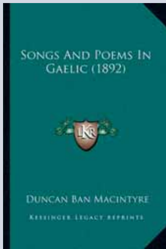
Buchcover: Songs and Poems in Gaelic (1892)