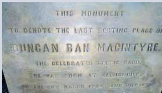
Gälische Inschrift auf Duncan Bàn MacIntyre's Memorial auf Greyfriars Kirkyard, Edingburgh, Schottland.

ponierte er sein Abschiedslied Cead Deireann nach dem Beann, „Letzter Gruß an die Berge“ bzw. „Ein Lebewohl an die Berge“, das die Eindrücke des gealterten Dichters schildert, wie sich der Berg und seine Umgebung seit seiner Zeit als Wildhüter verändert hatte. Und das hatte er zu Duncan Bàn's Kummer tatsächlich, denn man sah deutlich die Spuren der Clearances, die mittlerweile auch in Breadalbane betrieben wurden: