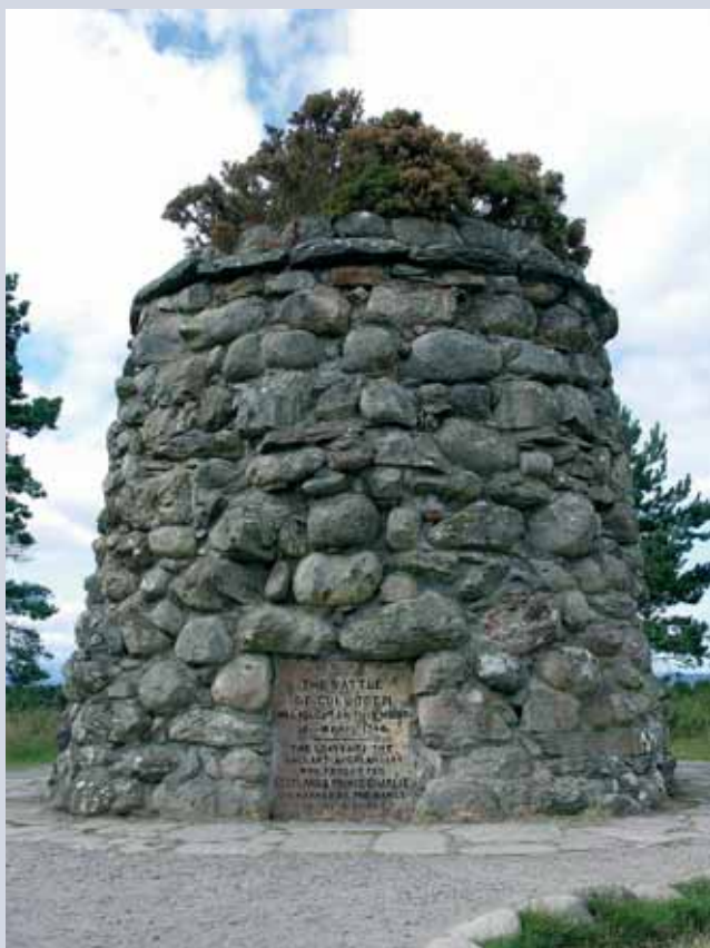
Denkmal auf dem Schlachtfeld von Culloden nahe Inverness, Schottland.