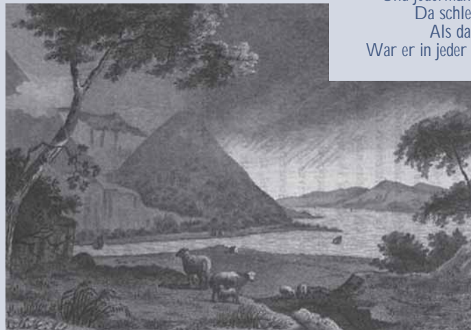
Ballachulish ( Baile Chaolais) am Loch Leven in einer Ansicht des 18. Jh.. Rechts der Wald von Lettermore, wo Colin Campbell von Glenure, Ziehbruder Duncan Bãos, am 14. Mai 1752 ermordet wurde.

Befördert vom Captain zum Major nach heldenhaftem Einsatz und Verwundung in der Schlacht von Kloster Kamp am 15. Oktober 1760, wie von Duncan Bàn in der sechsten Strophe der Elegie erwähnt, 26 fiel Archibald Campbell von Achallader nur achteinhalb Monate später im Gefecht von Vellinghausen. Um Ihnen die ganze Elegie, Cumha Ghilleasbuig Achaladair , „Totenklage des Archibald von Achallader“, die insgesamt vierzehn Strophen umfasst, wiederzugeben, fehlt hier der Platz, doch die wichtigsten Strophen – wie die fünfte und sechste – sollen hier vollständig wiedergegeben werden. Andere sollen in diesem Abschnitt je nach Kontext zeilenweise zitiert werden. Im Folgenden also zuerst die beiden Strophen, in denen die Schlachten von Kloster Kamp und Vellinghausen genannt werden: