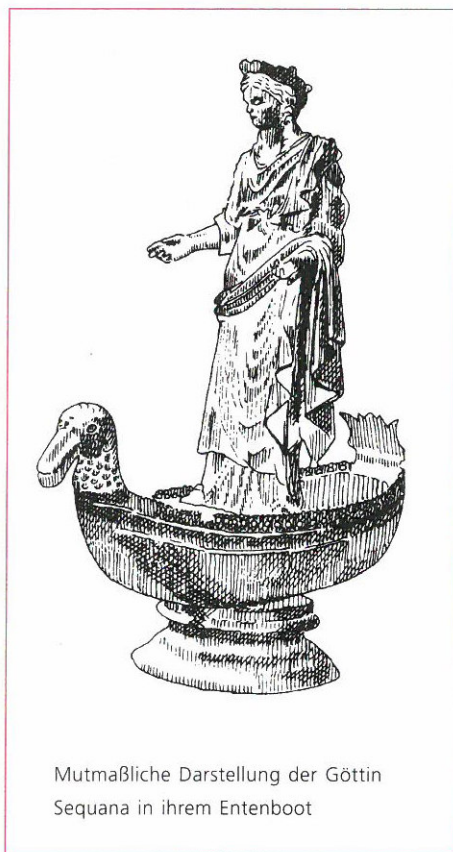
Mutmaßliche Darstellung der Göttin Sequana in ihrem Entenboot