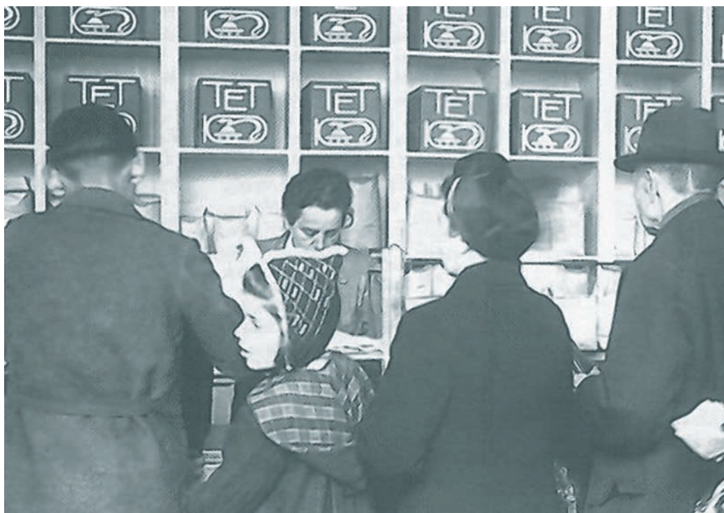
Verteilung von irischem Speck im Lebensmittelladen, Anfang 1946

A m 15. Januar 1946 erreichte eine weitere großzügige Butterspende Freiburg. Doch wurde die irische Butter – die Qualität übrigens wurde allgemein als ausgezeichnet gerühmt – nicht von allen Freiburgern freudig entgegengenommen; nicht alle bekamen einen Anteil und dies führte zu unverholener Kritik, wie sie in einem Brief (vom 26.1.1946) an den Oberbürgermeister vertreten wird. Dieser Brief ist ein Dokument der Zerrissenheit und der Wut, der Anfechtungen und der Kämpfe innerhalb der deutschen Bevölkerung, wie auch der nachdrücklichen Präsenz, der Gegenwärtigkeit des vergangenen NS-Regimes. Es soll hier aber nur in Auszügen zitiert werden. „Unbedingt enttäuschen und verletzen muss es aber,“ so die Freiburger Bürgerin, „wenn bei zweimaliger Verteilung jeweils das Hauptgewicht auf kinderreiche Familien fällt. Hat man so schnell vergessen, dass es gerade die begeistertsten Nazifrauen waren, die einerseits um des ihnen gebotenen Vorteils willen, andererseits um den Nazis zu imponieren, dem ‘Führer Kinder schenken’, oft in geradezu verantwortungsloser und menschenunwürdiger Weise, und schwerster Zeit fast pausenlos, um Darlehen, Zulagen usw. nicht zu verpassen?“ Das waren klare Worte und es fehlte auch nicht an Verbesserungsvorschlägen. Sie plädierte „Im Namen