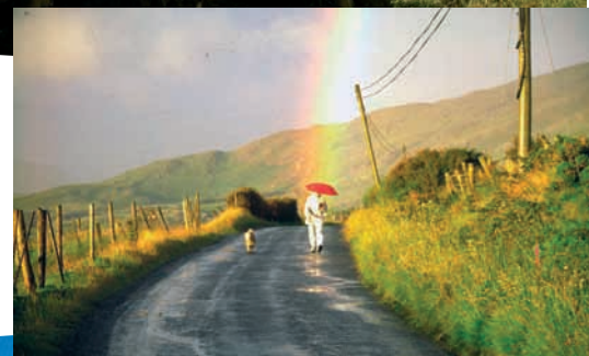
Eindrücke rund um Renvyle