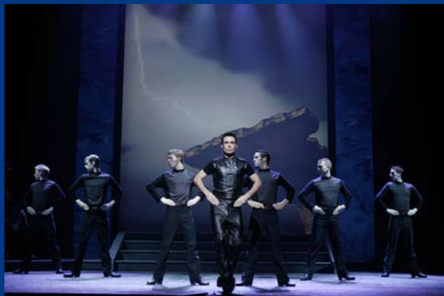
1995: Riverdance erobert Großbritannien.