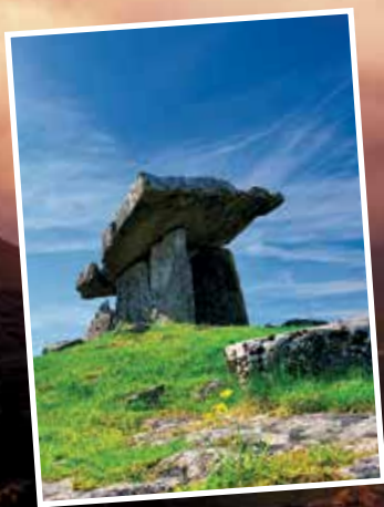
POULNABRONE DOLMEN / BURREN